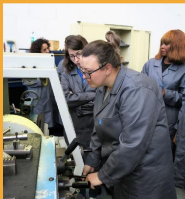
Le groupe de la Job Academy femmes dans l'Industrie en juin 2018

4 promotions lancées à Nantes et 4 à Saint-Nazaire (8 promotions annuelles)