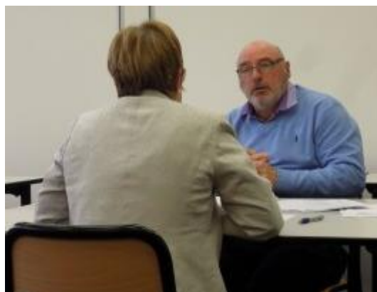
Un parrain et une jobbeuse au cours d'une séance de simulation d'entretien