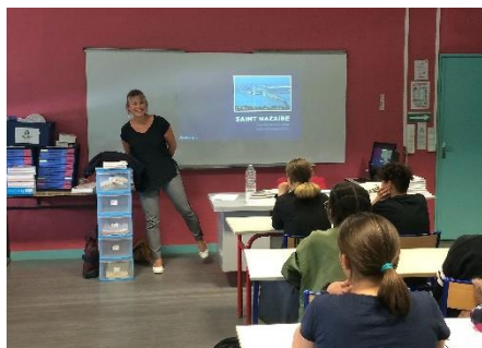
Intervention d'Adecco au collège Norange de Saint-Nazaire

En REP et rural : Arthur Rimbaud à Donges, Julien Lambot à Trignac La Ville aux Roses à Châteaubriant Bellevue à Guémené Penfao