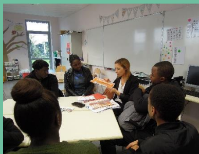
Une professionnelle de GRDF présente son métier au collègue Sophie Germain

Dans des établissements scolaires situés notamment en REP + (Réseau d'Education Prioritaire), REP ou zone rurale