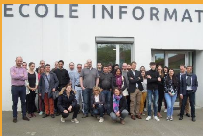
La 1 ère promotion Code Académie

Elle se déroule dans les locaux de l'ENI à Saint-Herblain.