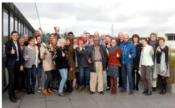
La 1 ère Job Academy intergénérationnelle lancée chez Ineo Atlantique en décembre 2018