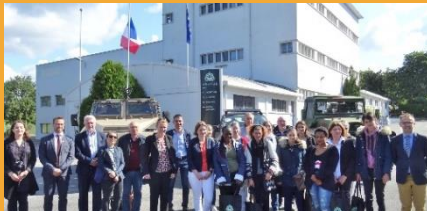
Lancement de la promotion FACE ô Femmes

Une 1 re promotion lancée en juin 2019 à Saint-Nazaire Cette action expérimentale pourrait être dupliquée sur un autre territoire