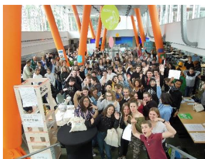
Le défi régional TEKNIK en mai 2019 à la salle des expositions de Nantes Métropole