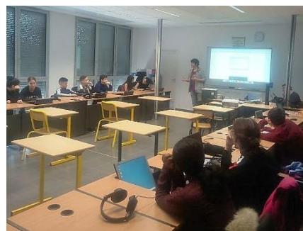
Intervention d'Epitech au collège Stendhal en mars 2019