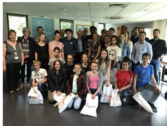
Bilan Discovery chez Total en juin 2019