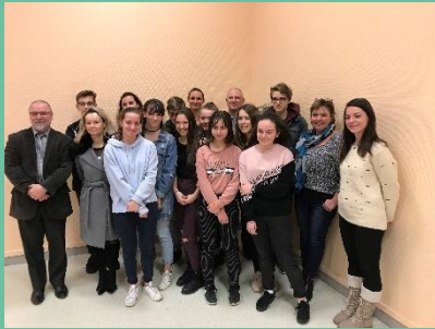
Rencontre Discovery au collège Jean Monnet en janvier 2019

L'accompagnement proposé au collégien est déconnecté de ses résultats scolaires et s'adapte à lui, en utilisant son langage et ses codes et en prenant en compte ses souhaits.